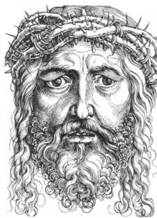
Albrecht Dürer, Chrystus