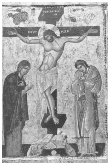
Ikona procesyjna z XIII wieku z kościoła Sveta Kliment (św. Klemensa) w Ohrydzie w Macedonii

Pomimo dość krótkiej historii pasjoniści mają w swoich szeregach