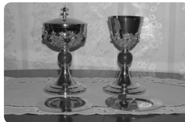
Kielich i puszka ofiarowane przez Róże Różańcowe

Ewangeliarz, Nadleśnictwa Rymanów i Lesko wsparły finansowo budowę ołtarza polowego, Sanocki Zakład Górnictwa Nafty i Gazu wspomógł finansowo wykonanie ławek