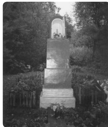
Kapliczka przy wielopolskim dworze

Po „krzysie przysięgowym” w lipcu 1917 roku, wstąpił do Polskiego Korpusu Posiłkowego. W listopadzie 1918 roku został przyjęty do odrodzonego Wojska Polskiego w randze pułkownika, dowodząc od lutego do lipca 1919 roku 11. Pułkiem Piechoty w wojnie polsko-ukraińskiej i z Rosją Sowiecką. Od sierpnia 1920 roku dowodził 38. Pułkiem Piechoty w ramach polskiej kontrofensywy przeciw bolszewikom.