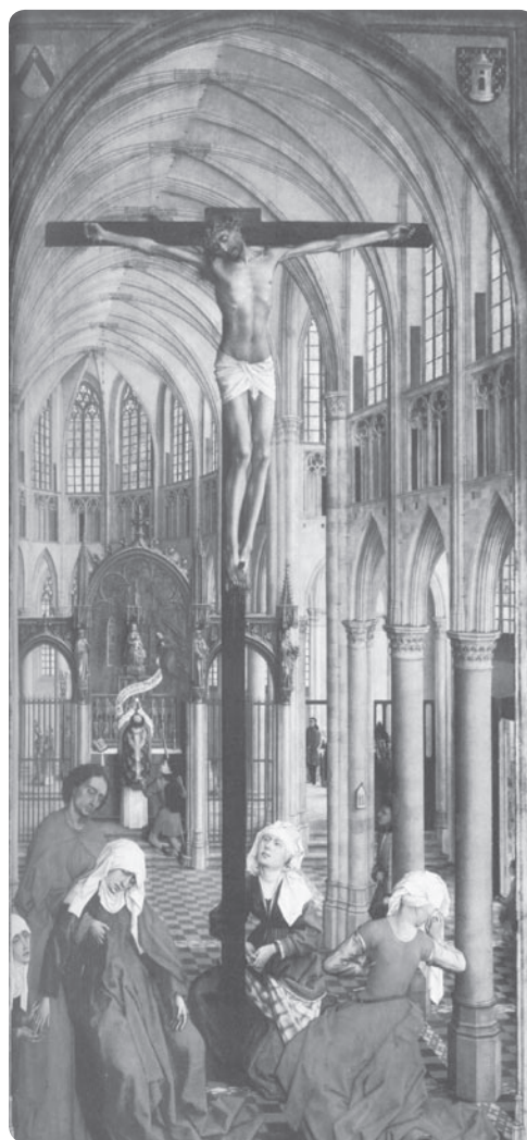
Rogier van der Weyden, Scena Ukrzyżowania, fragment środkowej tablicy tryptyku Siedem sakramentów, ok. 1453–1455