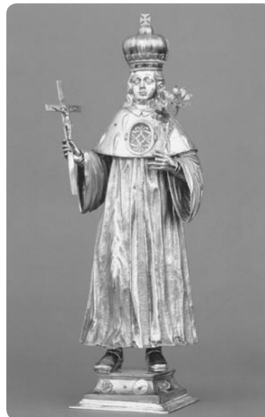
Relikwiarz św. Kazimierza

Św. Urszula Ledóchowska, składając hołd naszej całej przeszłości, pisze: „Jesteś nieśmiertelny kraju moich przodków. Jesteś nieśmiertelna Ojczyzno ukochana, Polsko moja. Nieśmiertelna przez swą odwieczną sławę, nieśmiertelna przez sztukę i literaturę, której nie sposób