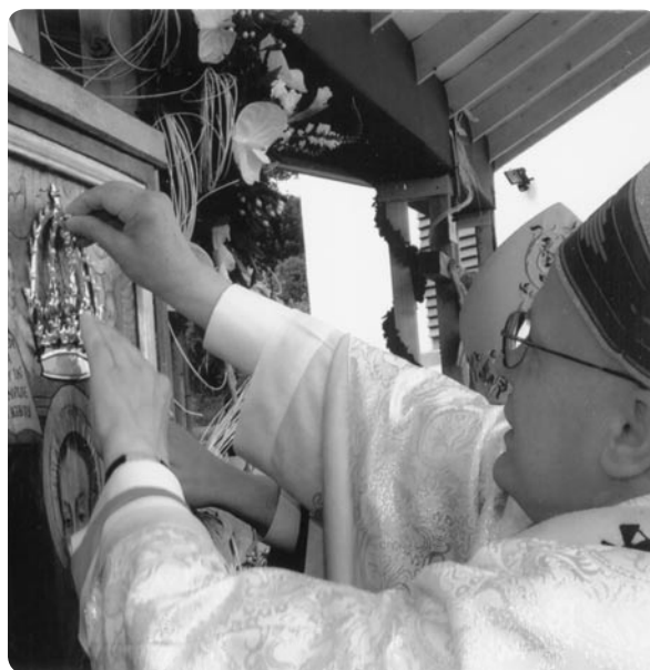
1 lipca 2007. Ksiądz Arcybiskup Józef Michalik zakłada koronę na wizerunek Matki Bożej Zagórskiej

Wielka uroczystość Koronacji obrazu Matki Bożej Zagórskiej, Matki Nowego Życia odbyła się 1 lipca, w niedzielę. Ponieważ szczegółowo pisaliśmy w „Verbum” o tych wydarzeniach, przypomnijmy tylko kilka cyfr: przybyło około 12 000 osób, Mszę Świętą, której przewodniczył ks. arcybiskup Józef Michalik, koncelebrowało ponad 120 księży, w tym 4 biskupów i 3 infułatów, rozdano 8 000 Komunii Świętej.