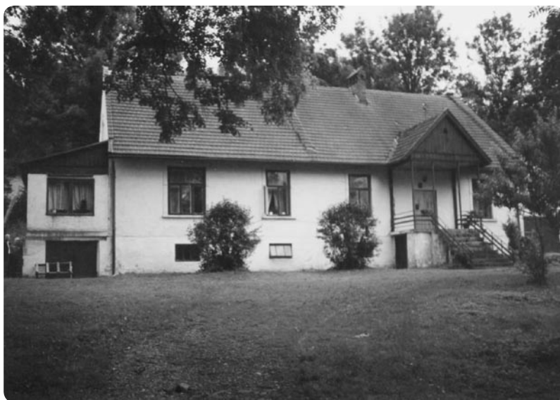
Dwór w Wielopolu, wybudowany w 1865 roku, stan obecny