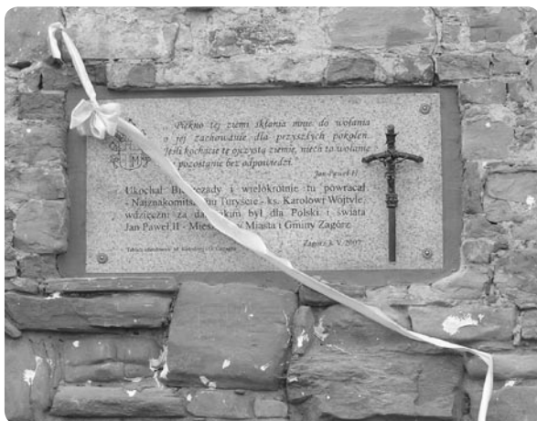
3 maja 2007. Otwarcie Szlaku Papiesskiego, tablica na murze klasztoru

W ruinach klasztoru tablicę umieszczono na ścianie kościoła. Szlak, zgodnie z intencją fundacji Szlaki Papiesskie, ma nie tylko zachęcać do poznania osoby i nauczania Ojca Świętego, ale skłonić do wędrówek