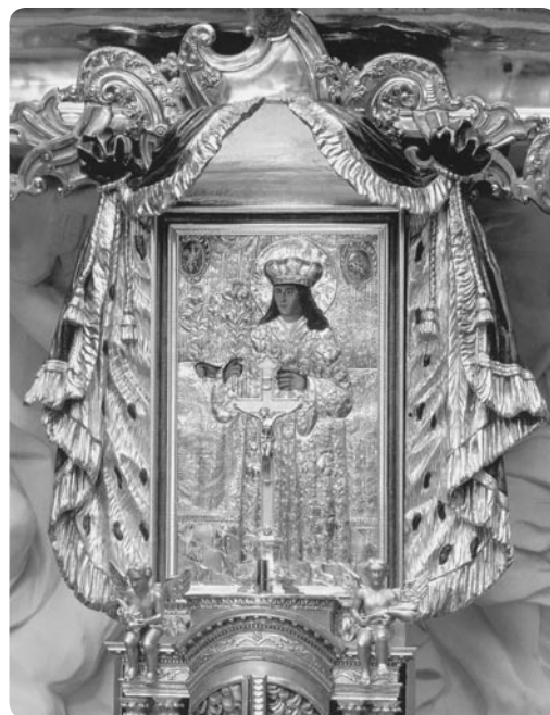
Ołtarz z wizerunkiem św. Kazimierza w katedrze wileńskiej

Nauczanie Chrystusa zapisane na kartach Ewangelii było dla